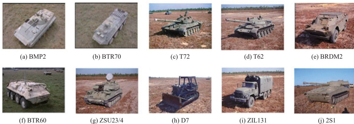
图 2 MSTAR 数据集包含的车辆目标图像

实验中还设置了一些对比方法, 它们包括参考文献 [25] 基于随机投影的方法 (Random projection), 该方法采用一维随机投影算法进行 SAR 图像降维; 参考文献 [26] 中二维随机投影的方法 (记为 2D random